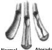
Normal Atorada Intermedia

PROGRAMA DE TERAPIA DE QUELATACIÓN - Use Mega-Chel , Lecithin , Colloidal Minerals , y Nature's Three por 1 mes por cada 10 años de vida. Tome 10 gramos de fibra al día. Ayuda a limpiar arterias y mejorar circulación. Para mayor detalle, consulte con su Especialista en Hierbas.